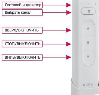
Рис. 1 — Назначение кнопок пульта

Общий канал недоступен для программирования, в нем осуществляется только управление ИУ.